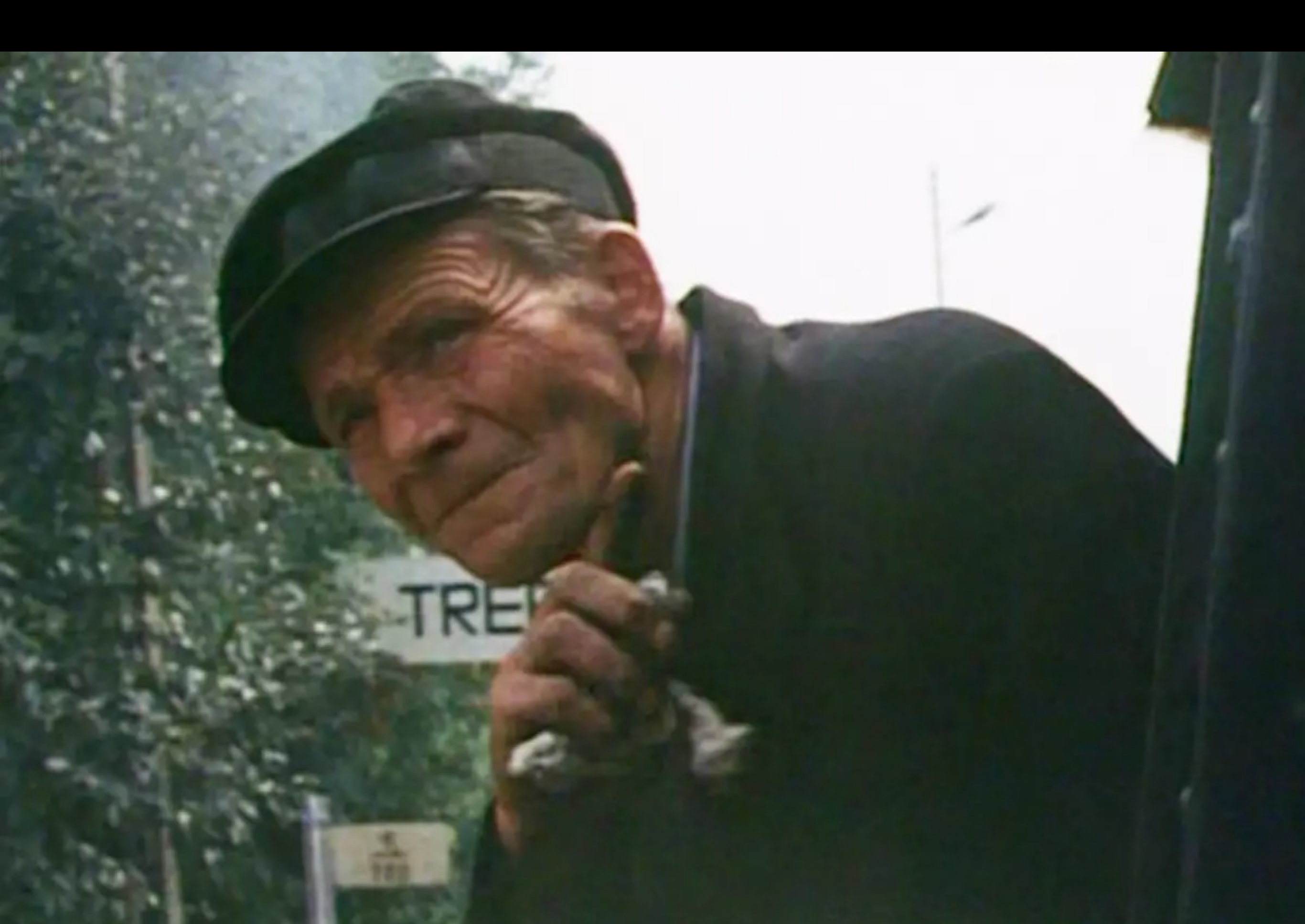
Cena de Shoah.